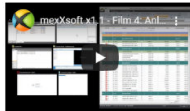
Film 4: Neuanlage eines Leistungsverzeichnisses. Diese LVs bilden die Grundlage für Kalkulation, Aufmaßerstellung, Angebot, Auftragsbestätigung und Rechnungsstellung