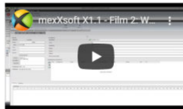
Film 2: Was ist ein Projekt? Erklärung und Arbeitsweise in mexXsoft X1.1