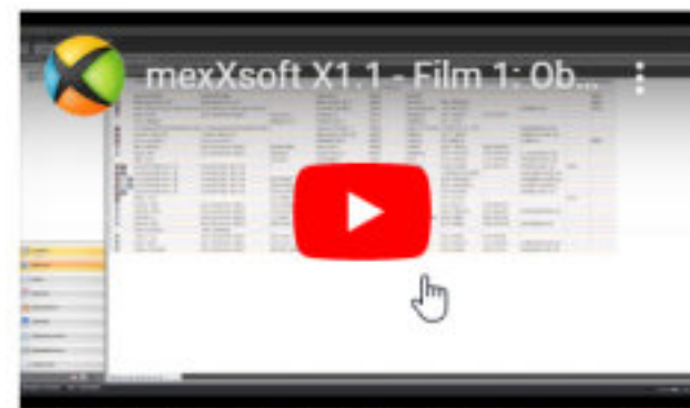
Film 1: Einführung in die Oberfläche und Bedienung von mexXsoft X1.1 am Beispiel der Projekte