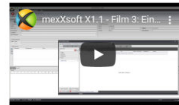
Film 3: Neuanlage eines Projektes in mexXsoft X1.1