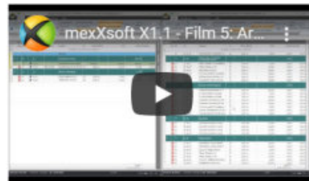
Film 5: Bearbeitung eines Leistungsverzeichnisses. Grundlegende Bedienung und Funktionen